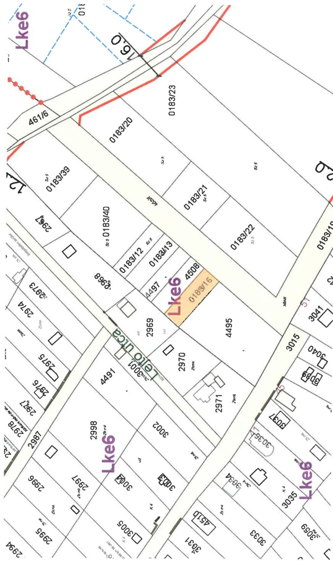
I. ábra: HÉSZ mellékletének 61. szelvényének kivonata