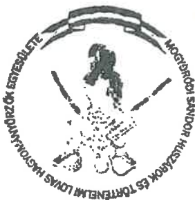
Sipos Imre elnök