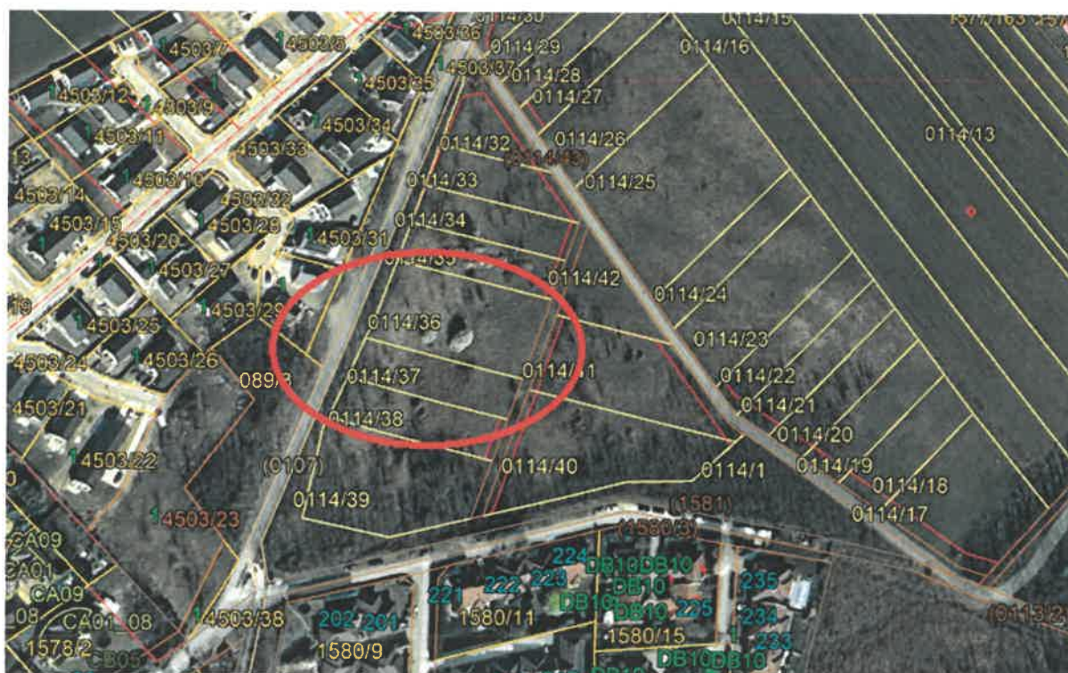
2. ábra Áttekintő térkép Mogyoród (ovális kör jelöli a tárgyi ingatlant)