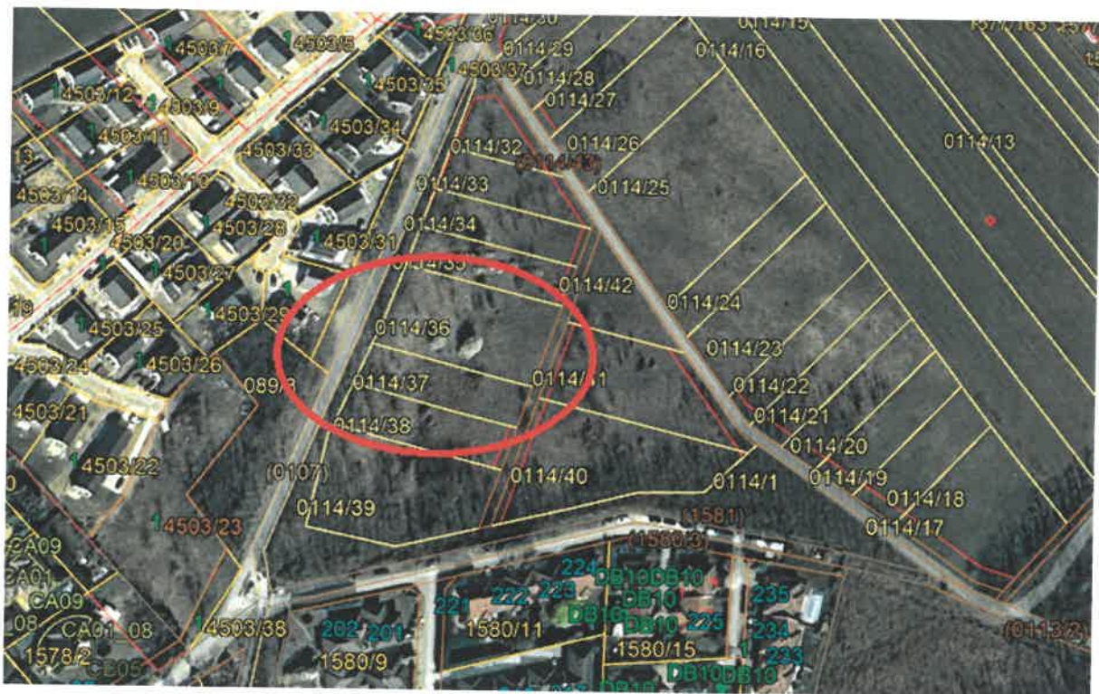
2. ábra Áttekintő térkép Mogyoród (ovális kör jelöli a tárgyi ingatlant)