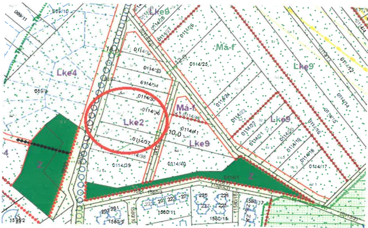
1. ábra HÉSZ mellékletének 53. szelvény kivonata (ovális kör jelöli a tárgyi ingatlant)

A belterületbe csatolás előtt a tulajdonosoknak az ingatlant ki kell vonattni termelésből. A HÉSZ alapján az ingatlant útleadás érinti.