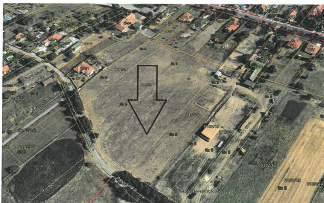
2. ábra Áttekintő térkép Mogyoród