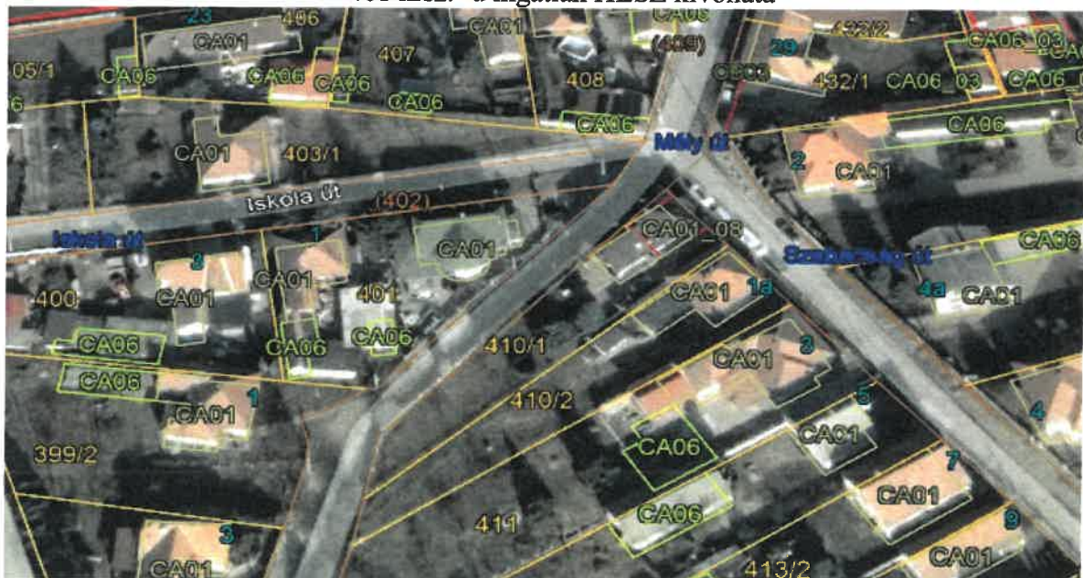
401 hrsz. -ú. ingatlan Google Earth Pro