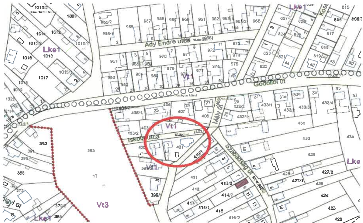
401 hrsz. -ú ingatlan HÉSZ kivonata

„Véleményem szerint akkor érdemes megvenni, ha van reális esély a teljes telektömb megvételére, ellenkező esetben nem javaslom.”