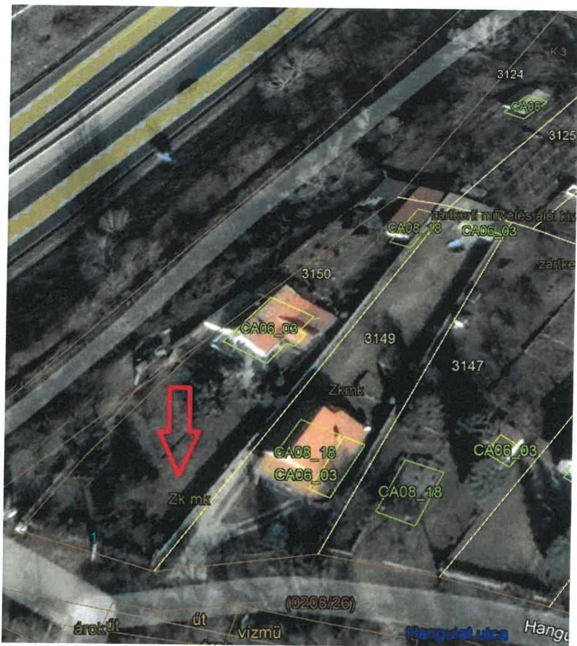
2. ábra Áttekintő térkép Mogoródról (piros nyíl jelöli a tárgyi ingatlan elhelyezkedését)

Tájékoztatom a képviselő-testületet, hogy az ingatlan tulajdonosának 2023. október 27-én benyújtott belterületbe vonási kérelme ügyében a testület nem járult hozzá, hogy a kérelmezett ingatlan belterületi telekké alakuljon, amelyről a 2023.11.27-i ülésén a következő határozattal döntött: