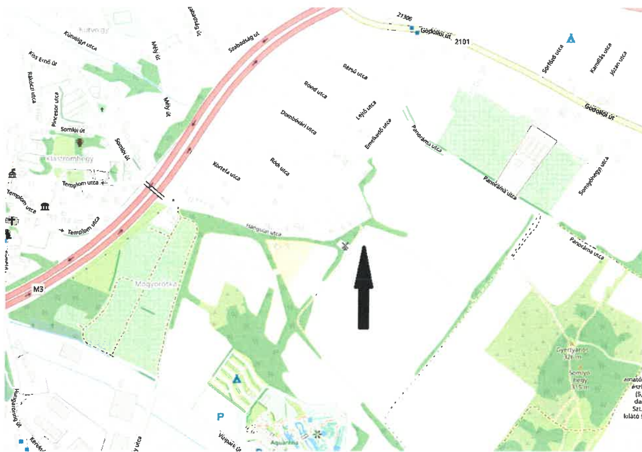
2. ábra Áttekintő térkép Mogyoródról (fekete nyíl jelöli a tárgyi ingatlan elhelyezkedését)

Tájékoztatom a Tisztelt Képviselő-testületet, hogy korábban, a július havi rendes ülésének folytatásán, az augusztus 3-i rendkívüli ülésén tárgyalt a kérelemről, s akkor a 292/2023.(VIII.3.) Kt. határozatával 2 igen 5 nem szavazati aránnyal elutasította. Változatlan tényállás mellett kérem a t. Képviselő-testületet, hogy döntsön a kérelemről!