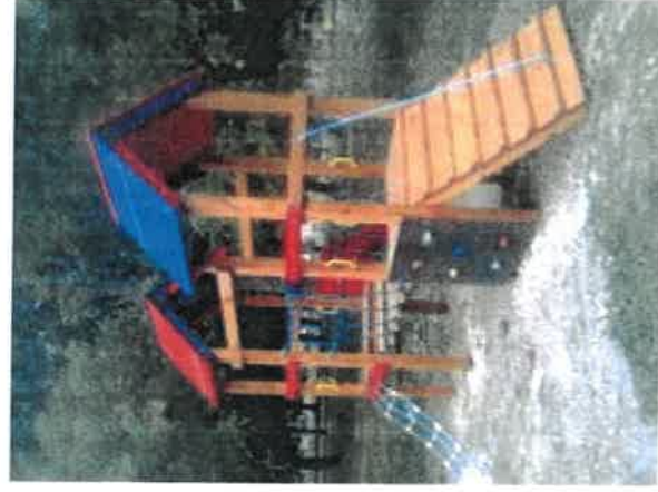
Kéttornyos függőhíd tetővel