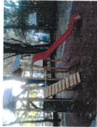
Kéttornyos függőhidas vár