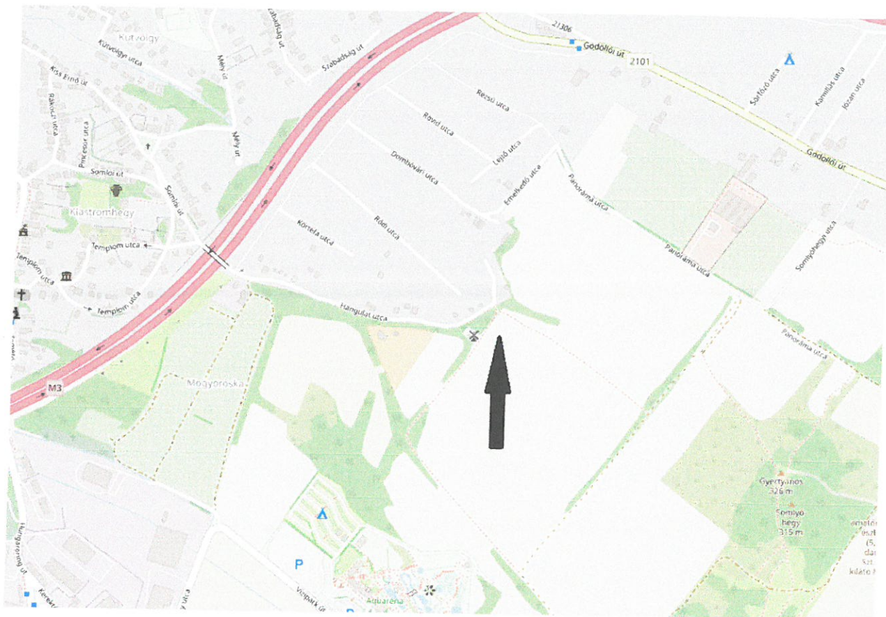
2. ábra Áttekintő térkép Mogyoródról (fekete nyíl jelöli a tárgyi ingatlan elhelyezkedését)

Kérem a t. Képviselő-testületet, hogy döntsön a kérelemről!