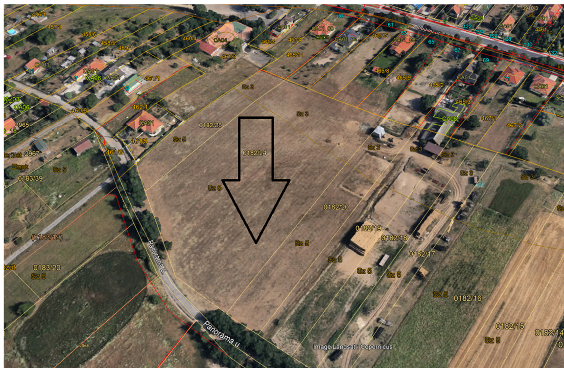
2. ábra Áttekintő térkép Mogoródról (fekete nyíl jelöli a tárgyi ingatlan elhelyezkedését)