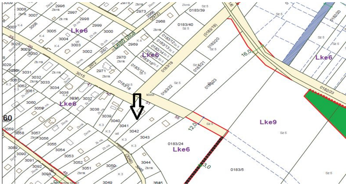
1. ábra HÉSZ 2. mellékletének 61. szelvény kivonata (nyíl jelöli a tárgyi ingatlant)

Az újabb kérelem során az ingatlan tulajdonosa a belterületbe vonási kérelemmel kapcsolatosan úgy nyilatkozott, hogy önkormányzati költségekhez történő önkéntes hozzájárulás jogcímén hozzájárulást NEM VÁLLAL.