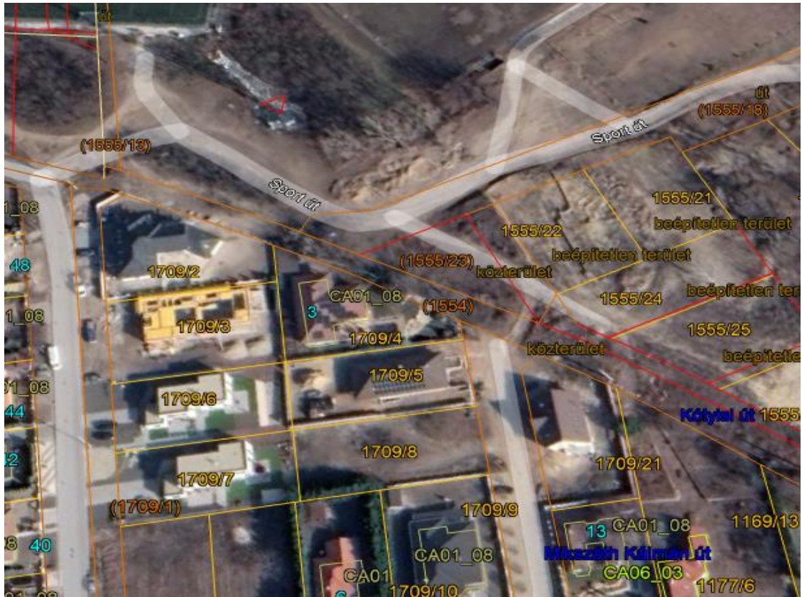
1557/23 hrsz ingatlan.