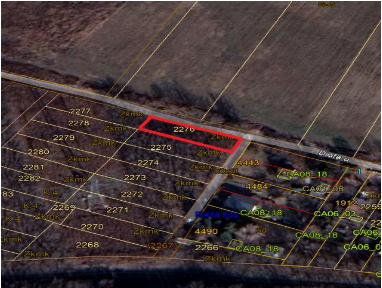
2276 hrsz ingatlan.