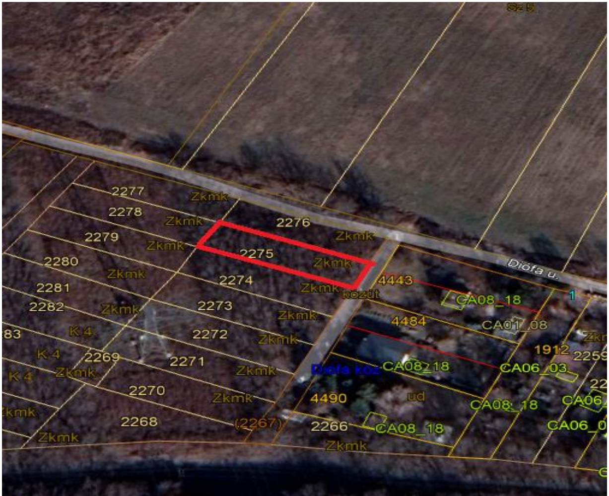
2275 hrsz ingatlan.