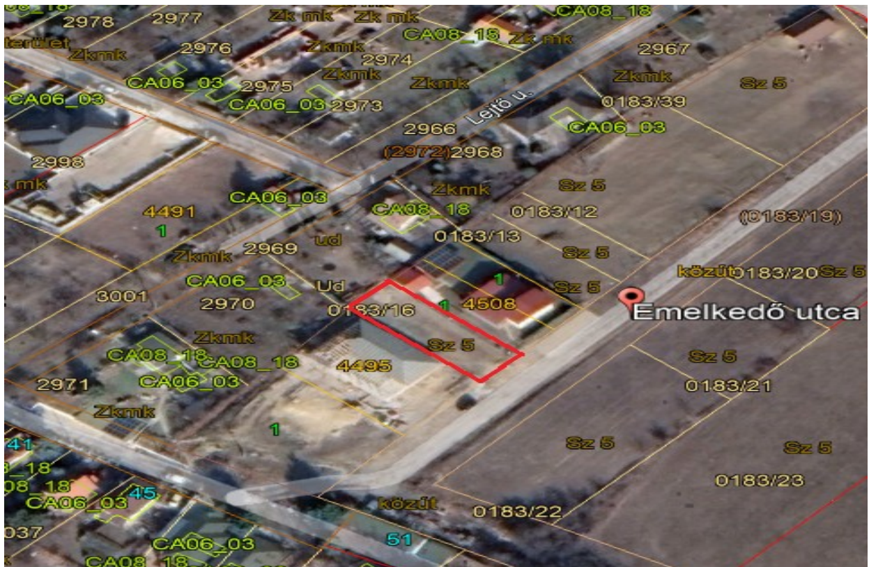
4557 hrsz ingatlan.