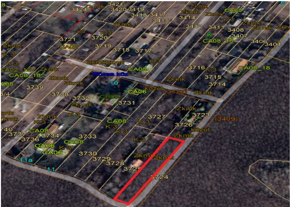
3724 hrsz ingatlan.