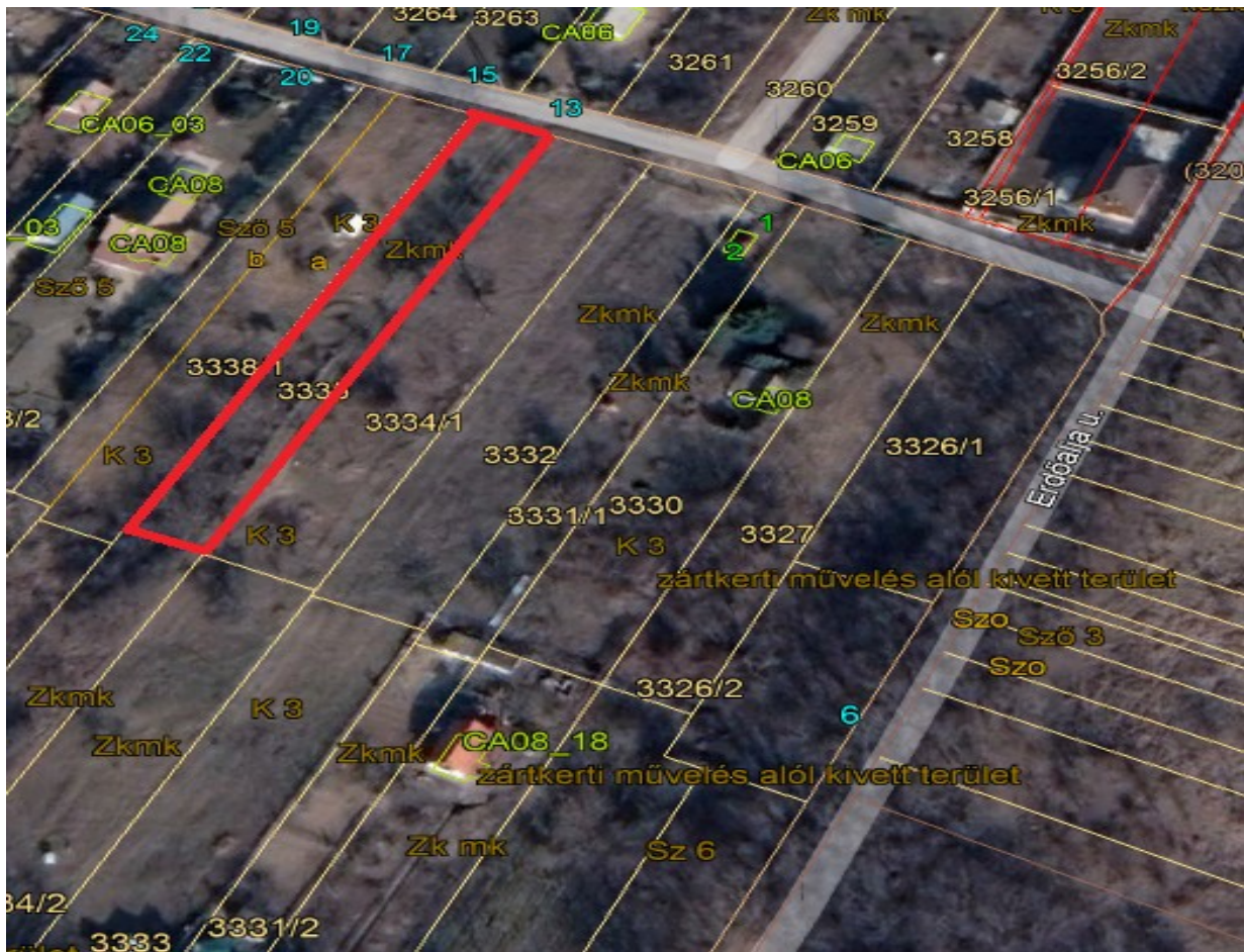
3335 hrsz ingatlan.