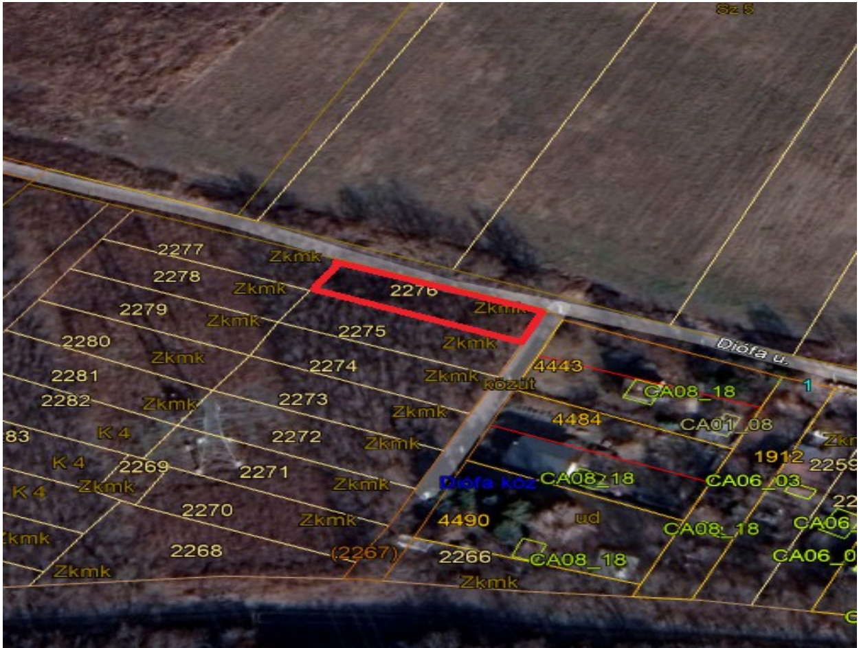
2276 hrsz ingatlan.