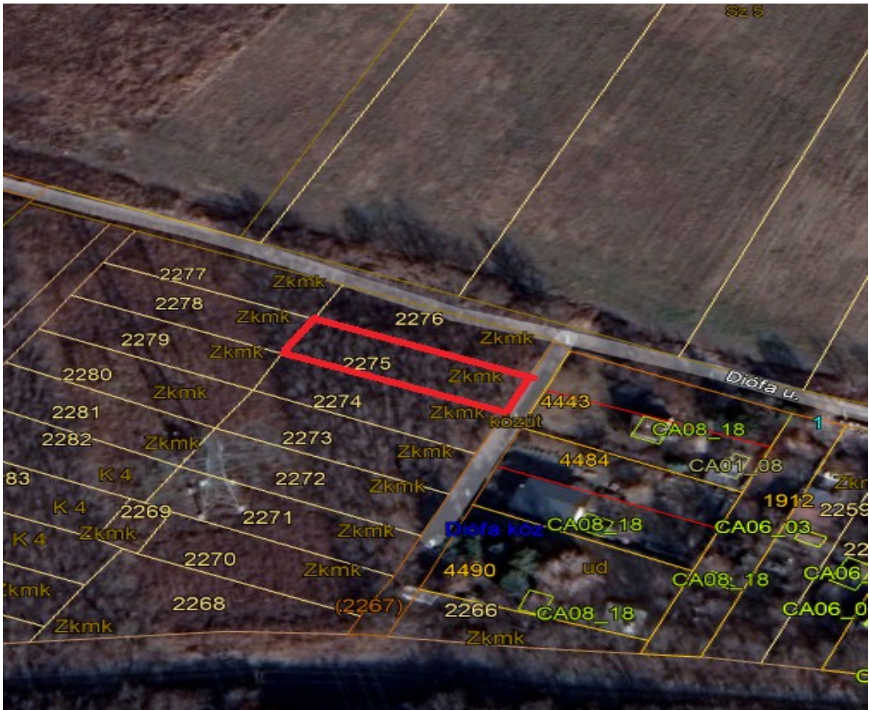
2275 hrsz ingatlan.