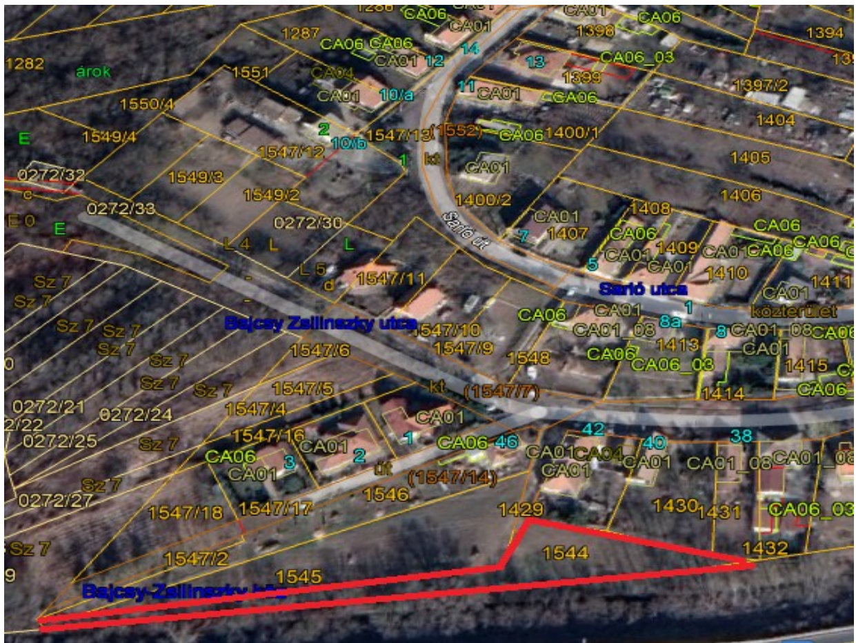
1544 hrsz ingatlan.