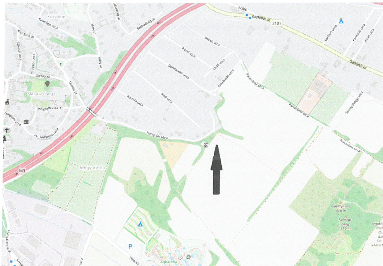
2. ábra Áttekintő térkép Mogyoródról (fekete nyíl jelöli a tárgyi ingatlan elhelyezkedését)

Kérem a t. Képviselő-testületet, hogy döntsön a kérelemről!