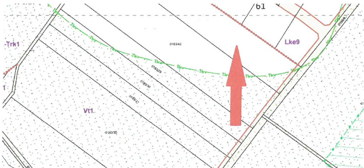
2. ábra HÉSZ 2. mellékletének 73. szelvény kivonata (nyíl jelöli a tárgyi ingatlant)