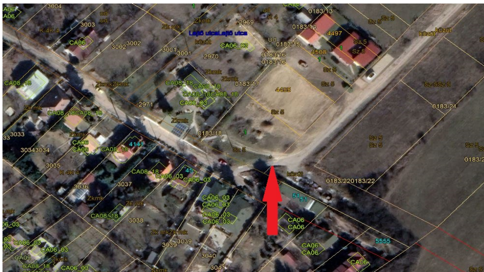
A 4495 hrsz ingatlan Google fotója, melyen látszik az útestnek használt ingatlanrész

(3) Ingatlanulajdon megszerzése esetén a döntés előkészítése során vizsgálni kell, hogy az ingatlan megszerzése milyen önkormányzati célok megvalósításához és milyen feltételek mellett alkalmas, fel kell tárni a tovább hasznosítási lehetőségeit, illetve a várható üzemeltetési költségek körét és nagyságát is.”