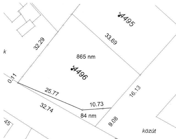
Vázrajz-részlet a leválasztott területről