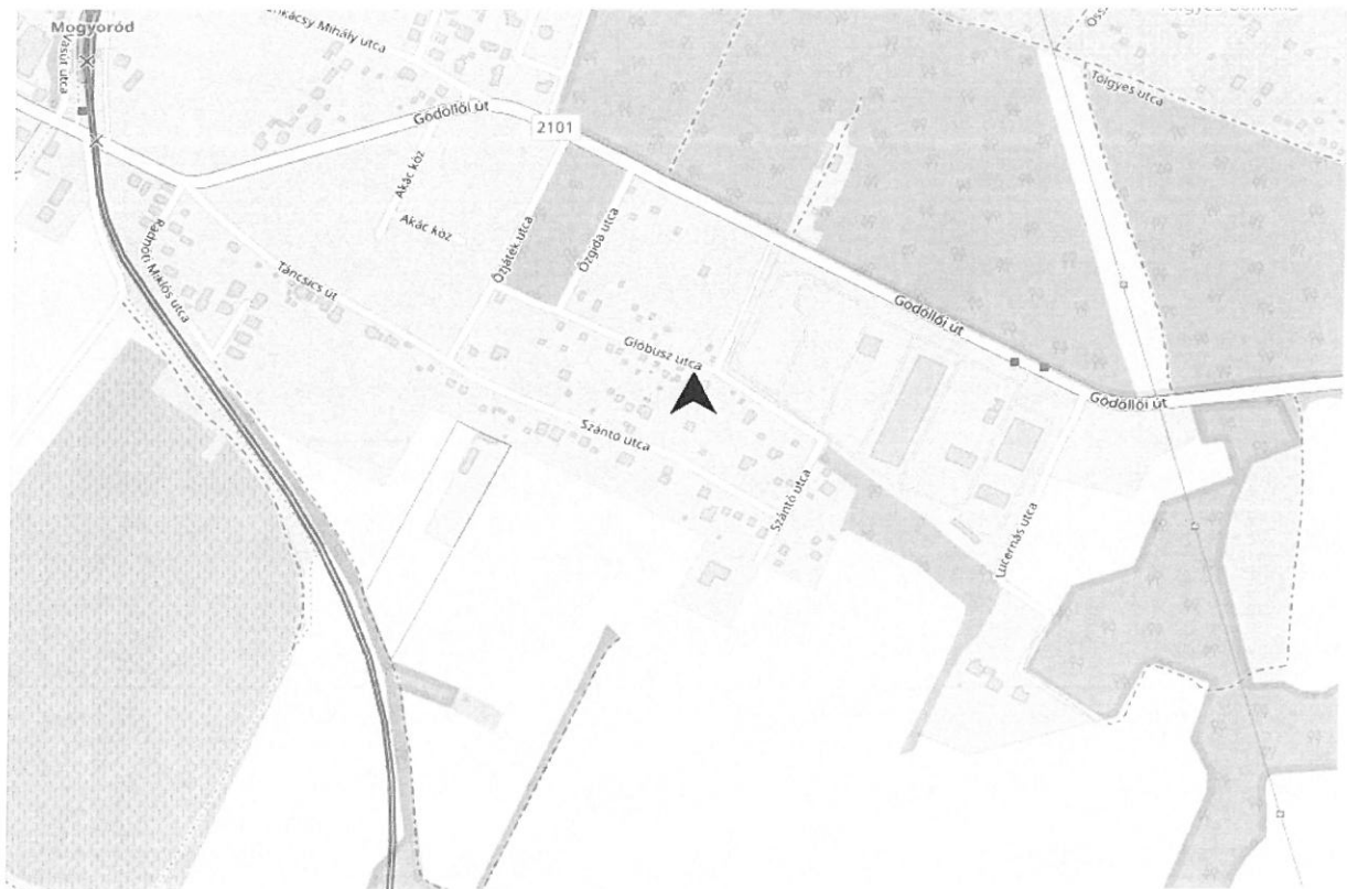
2. ábra Áttekintő térkép Mogyoródról (fekete nyíl jelöli a tárgyi ingatlan elhelyezkedését)