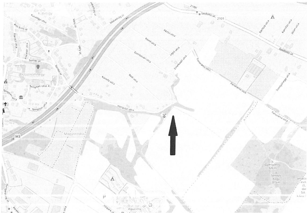
2. ábra Áttekintő térkép Mogyoródról (fekete nyíl jelöli a tárgyi ingatlan elhelyezkedését)

Kérem a t. Képviselő-testületet, hogy döntsön a kérelemről!