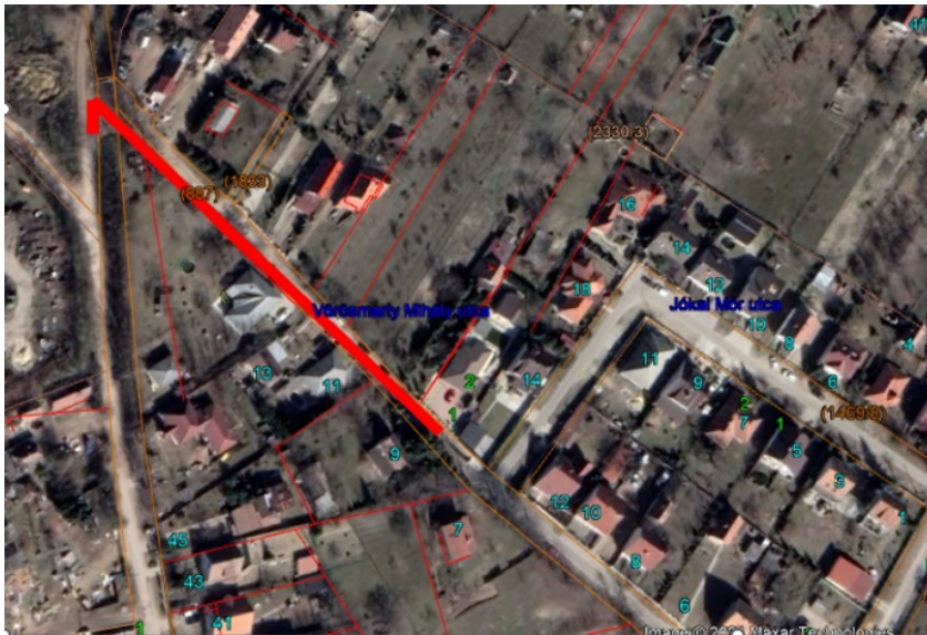
2. ábra Átnézeti térkép (csökkentett tartalom)

Az útépitési munkákra vonatkozó korábbi tervezői költségvetés aktualizálása 2022.09.09-én megtörtént.