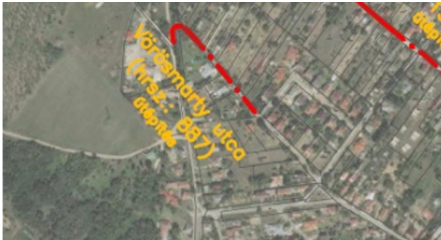
1. ábra Átnézeti helyszínrajz részlet (eredeti tervdokumentáció)

Az útépitési munkákra vonatkozó korábbi tervezői költségvetés aktualizálása 2022.09.09-én megtörtént.