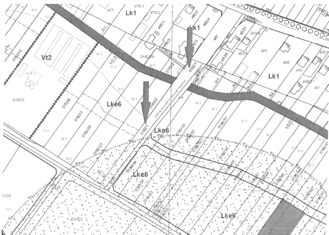
0182/1 hrsz. ingatlan HESZ kivonata

A 0182/1 hrsz.-ú ingatlan mellett található a 0181 hrsz.-ú kivett árok, mely a Magyar Állam tulajdonában van, ennek ingyenes átruházásának kérelmét már benyújtottuk a Nemzeti Földügyi Központhoz.