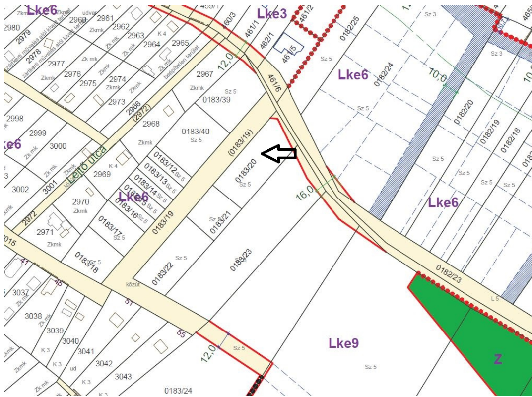
1. ábra HÉSZ 2. mellékletének 61. szelvény kivonata (nyíl jelöli a tárgyi ingatlant)

Az ingatlan Lke9 övezetben található, szabályozási vonallal érintett. A telekalakítási eljárás a korábbiakban nem lett végrehajtva, azonban az ingatlan tulajdonosa vállalja így is a belterületbe vonást, valamint a 2000,- Ft/m 2 településfejlesztési hozzájárulás megfizetését. Az ingatlanból a határozati javaslatban megjelölt telek alakul ki a belterületbe vonással.