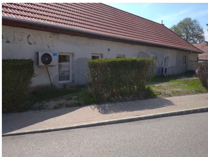
2. ábra Családsegítő Dózsa György út felőli homlokzata

Az épület Dózsa György út felőli homlokzatán lévő 2 db klíma kültéri egységeit többször súlyosan megrongálták, ezért célszerű lenne őket áthelyezni a Hangya Terasz (belső udvar) felőli tetőre. Így a későbbi falakat érintő felújításokat és szigetelési munkákat sem akadályozná. A klímák áthelyezésének költsége a SO-NA Klíma Bt. ajánlata alapján bruttó 516.240,- Ft.