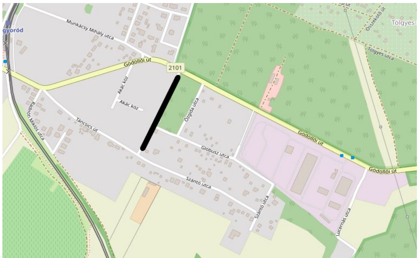
2. ábra Áttekintő térkép Mogyoródról (fekete vonal jelöli a tárgyi ingatlan elhelyezkedését)