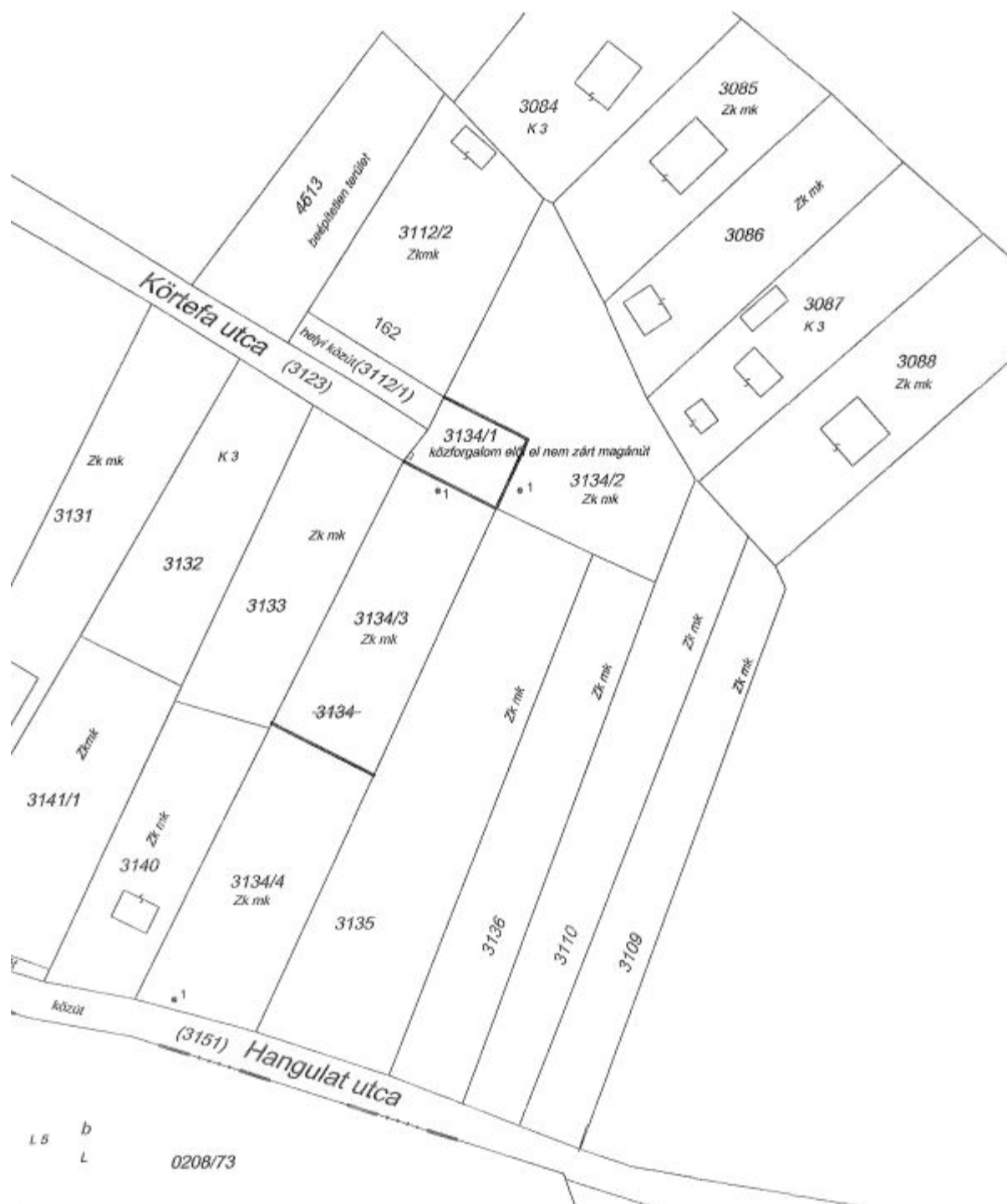
3. ábra Záradékolts változási vázrajz, 3134/1-4 hrsz-ú ingatlanok