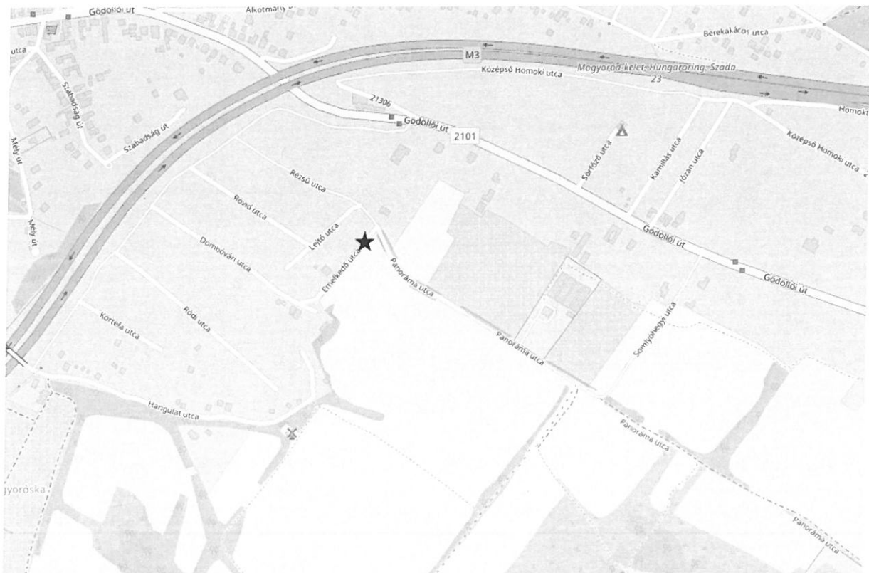
2. ábra Áttekintő térkép Mogyoródról (fekete csillag jelöli a tárgyi ingatlan elhelyezkedését)