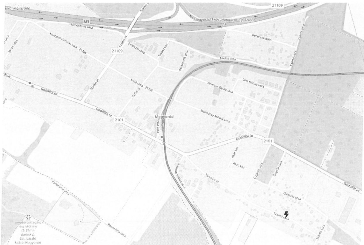
2. ábra Áttekintő térkép Magyoródról (fekete villám jelöli a tárgyi ingatlan elhelyezkedését)