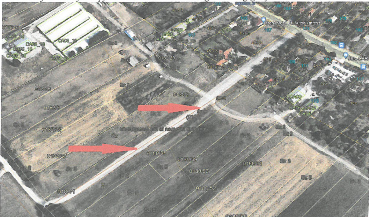
0181 hrsz. ingatlan

A NFK tájékoztatója alapján tehát a 0181 hrsz.-ú ingatlan megigényelhető.