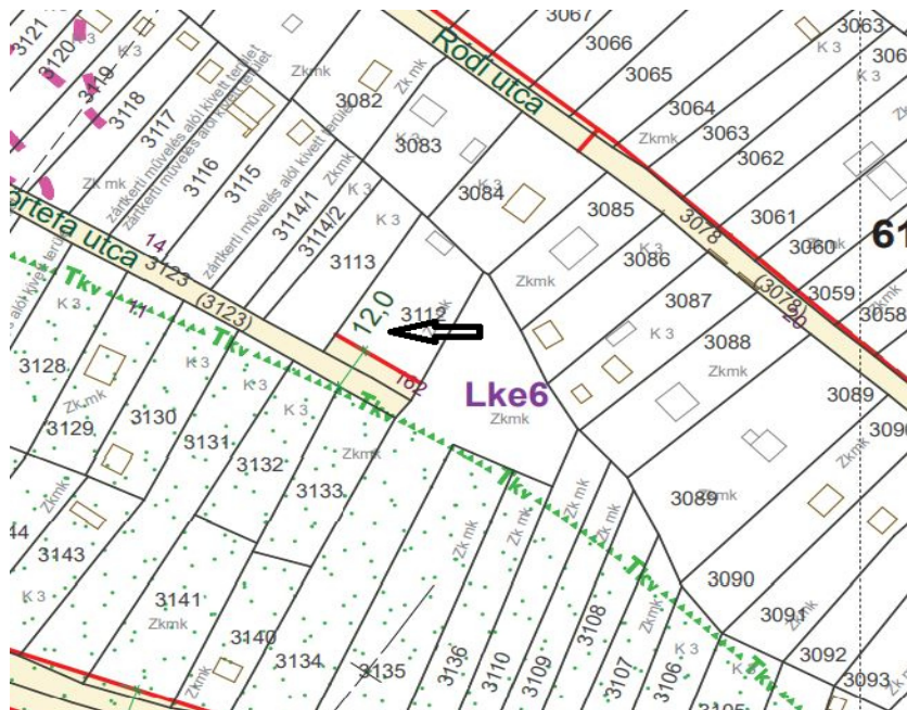
1. ábra HÉSZ 2. mellékletének 60. szelvény kivonata (nyíl jelöli a tárgyi ingatlant)