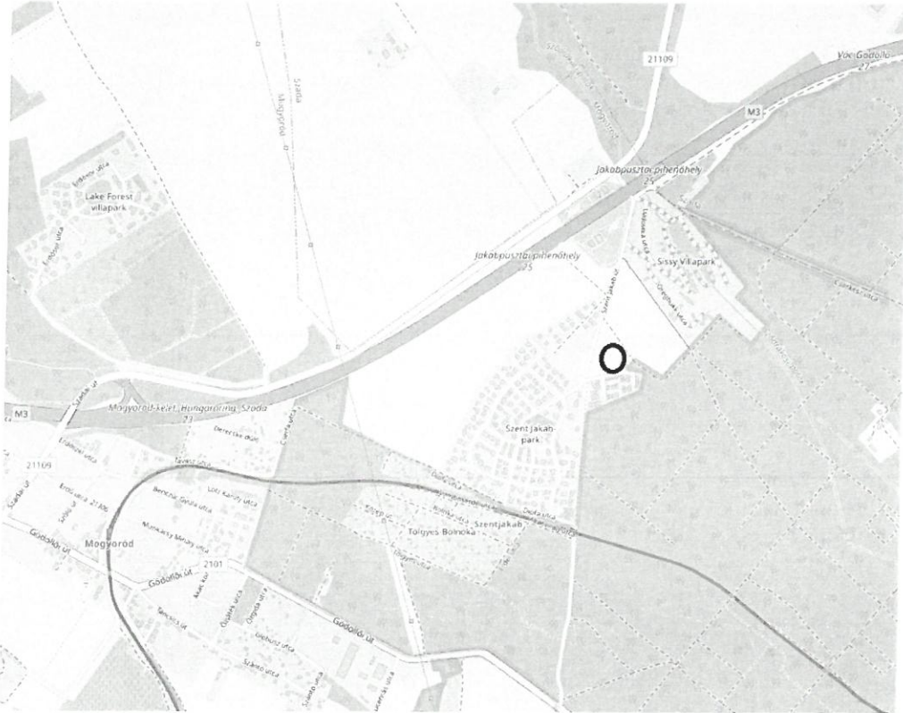
2.ábra Áttekintő térkép Mogyoródról (Fekete kör jelöli a tárgyi ingatlan elhelyezkedését)

Kérem a T. Képviselő-testületet, hogy a határozati javaslat szerint hozza meg döntését.