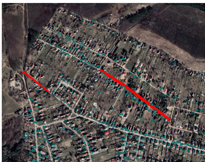
2. ábra I. ütem Átnézeti térkép (1.Opció)

Az I. ütem tartalmazza a Borvirág utca Szánkó utca – Nagyhomoki utca közötti szakasz megvalósítását a 0+000 – 0+430 szelvények között.