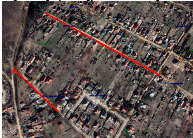
3. ábra II. ütem Átnézeti térkép (2.Opció)

A II. ütem tartalmazza a Borvirág utca Nagyhomoki utca - Vörösmarty utcával párhuzamos szakasz megvalósítását a 0+430 – 0+810 szelvények közötti útszakasz vonatkozásában, mely magában foglalja a Nagyhomoki-Borvirág u. kereszteződést is.