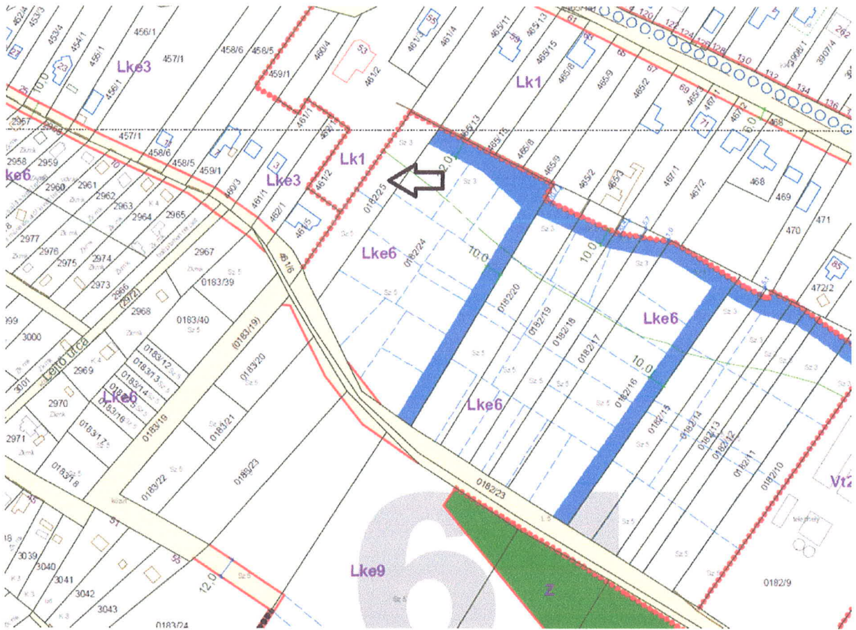
1. ábra HÉSZ 2. mellékletének 61. szelvény kivonata (nyíl jelöli a tárgyi ingatlant)