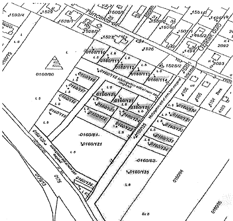
3. ábra Ingatlan-nyilvántartási megosztási vázrajz (Kiemelt helyrajzi számok a lakótelek, amelyek megközelítését szolgálják a tárgyi utak)

Kérem a Tisztelt Képviselő-testületet, hogy döntsön az utak belterületbe vonásáról.