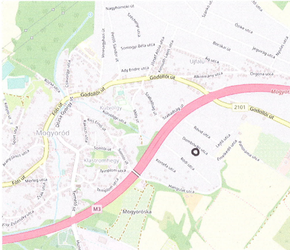
2.ábra Áttekintő térkép Mogyoródról (Fekete kör jelöli a tárgyi ingatlan elhelyezkedését)