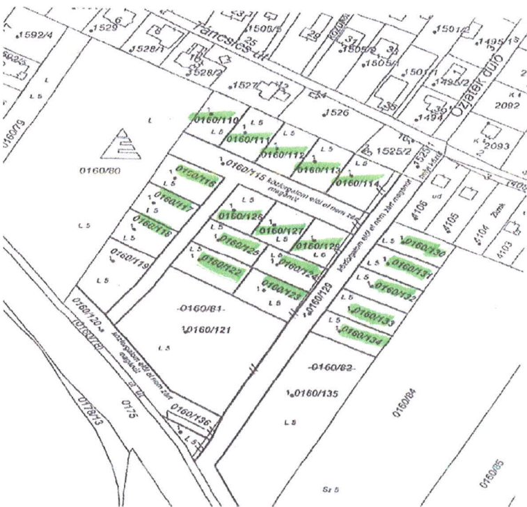
3. ábra Ingatlan-nyilvántartási megosztási vázrajz (Kiemelt helyrajzi számok a lakótelkek, amelyek megközelítését szolgálják a tárgyi utak)

Kérem a Tisztelt Képviselő-testületet, hogy döntsön az utak belterületbe vonásáról.