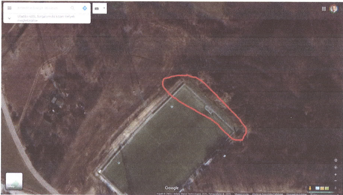
I. ábra Google légi felvételen jelölve a beruházással érintett terület

Mogyoród Nagyközség Önkormányzat 2020. évi költségvetésében a sportegyesületek támogatására 0 Ft előirányzat lett megállapítva. Tekintettel arra, hogy az önkormányzati tulajdonú vagyon gyarapodik a beruházással, ezért javasolt ezen célra a forrás biztosítása.