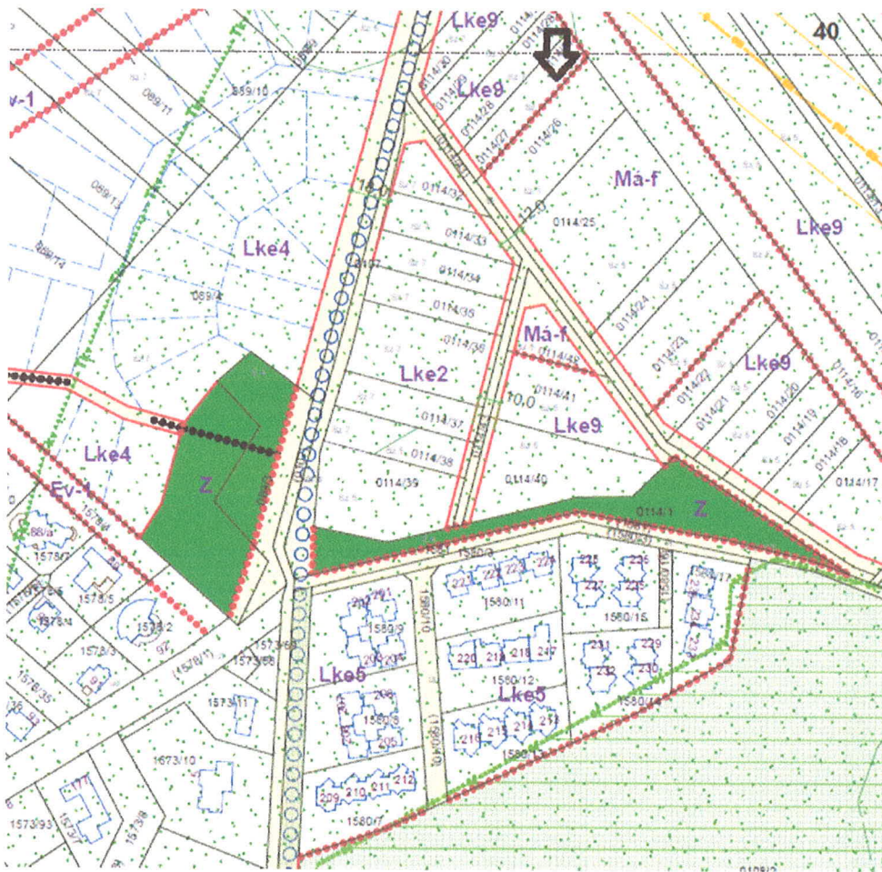
1. ábra HÉSZ 53. szelvény kivonata