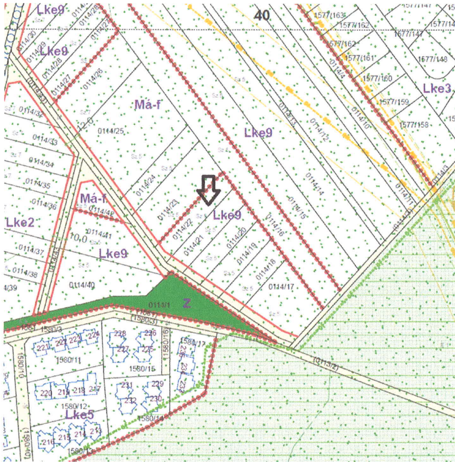
1. ábra HÉSZ 53. szelvény kivonata