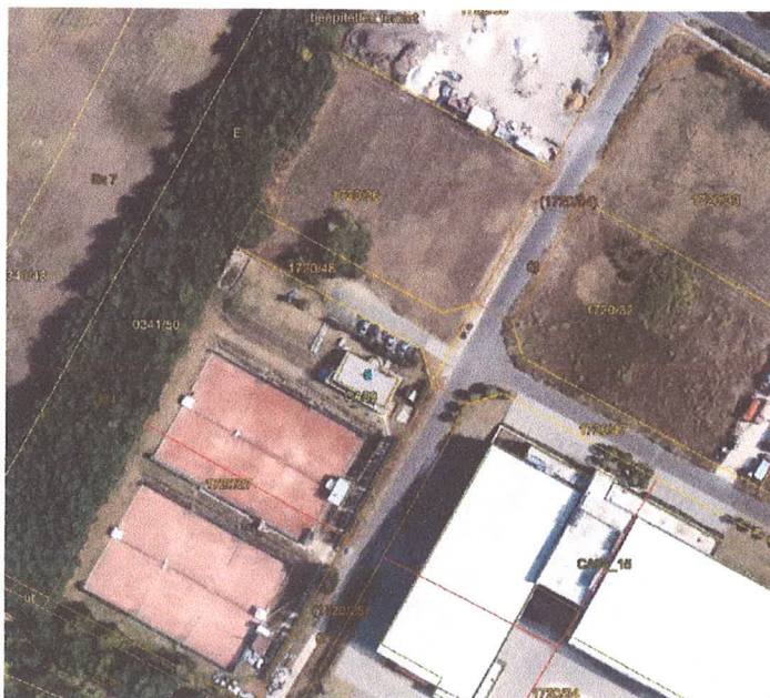
2. ábra Térképi részlet

Mindezek lefolytatása után lehet a 1720/48 hrsz ingatlan értékesíteni.