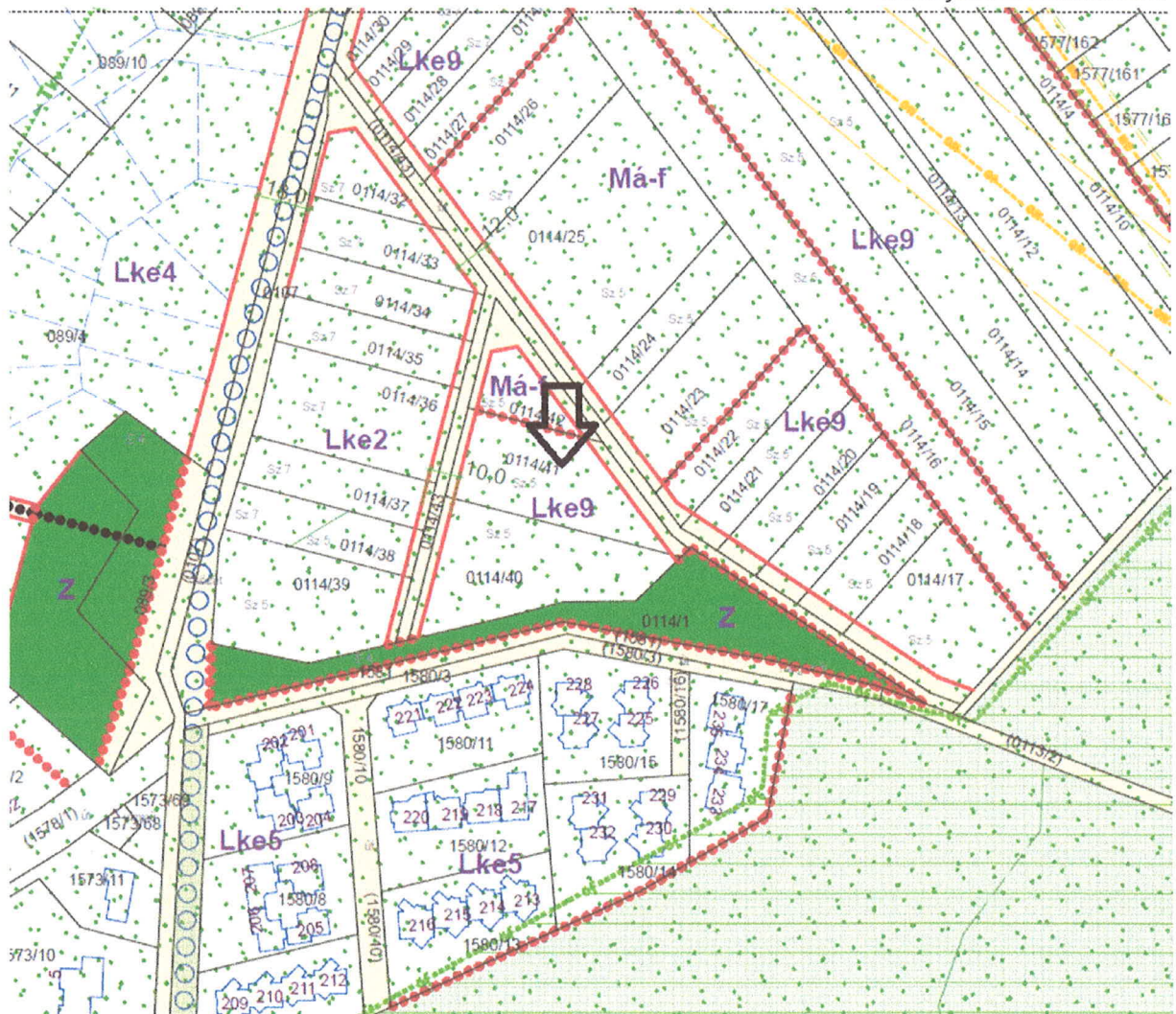
I. ábra HÉSZ 53. szelvény kivonata