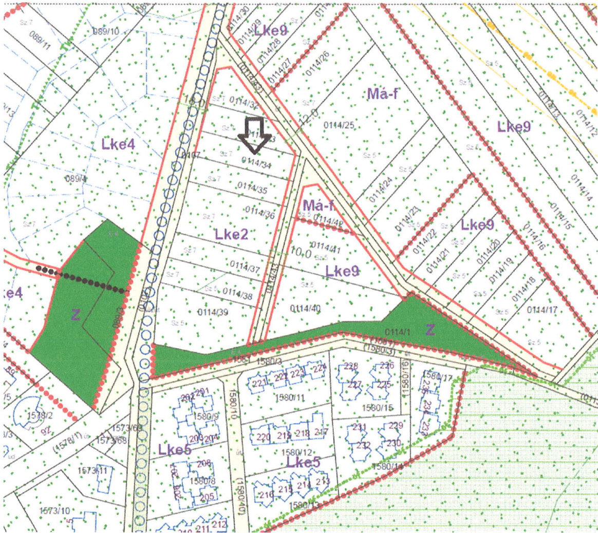
1. ábra HÉSZ 53. szelvény kivonata