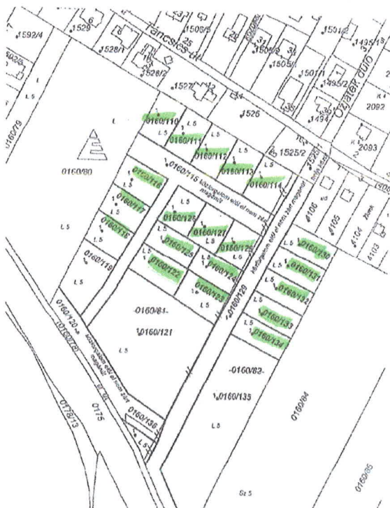
2. ábra Ingatlan-nyilvántartási megosztási vázrajz

Kérem a Tisztelt Képviselő-testületet, hogy döntsön a belterületbe vonási kérelemről.