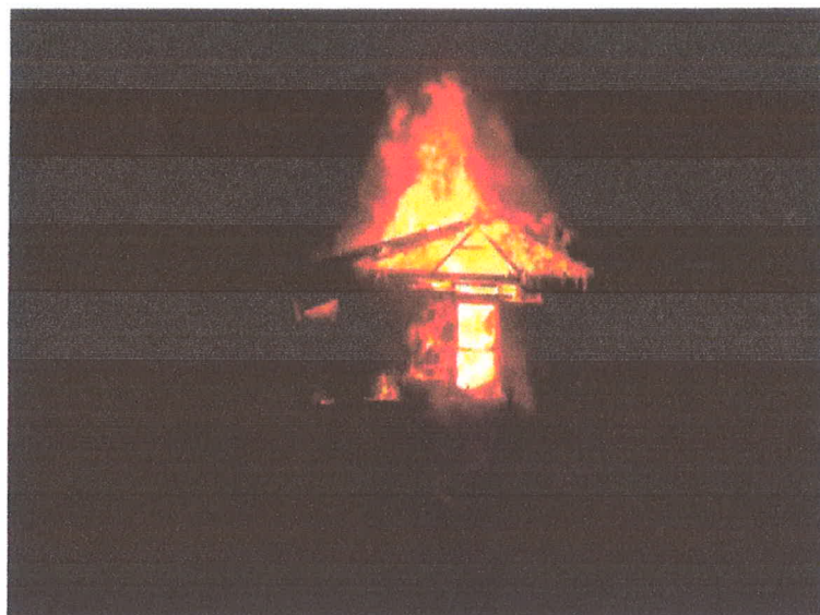
1. számú kép