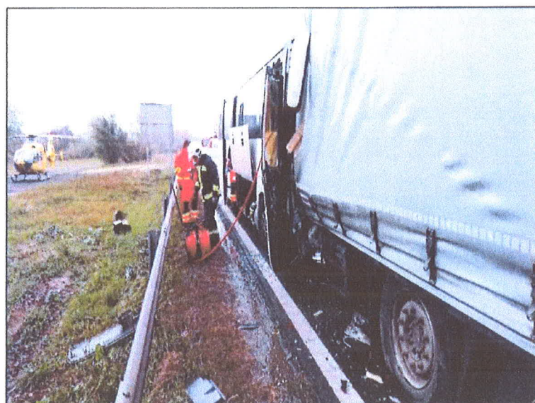
2. számú kép