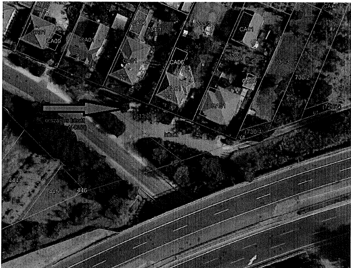
743/2 hrsz ingatlan Google fotója